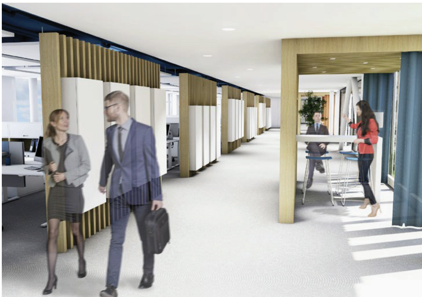
L'aménagement des bureaux, conçu par le designer Claudio Colucci, propose une administration en open space et alterne places de travail et salles de réunion pour casser la linéarité d'un couloir de 100 m de long. Un claustra, qui alterne de larges et élégantes lattes de bois dans lesquelles sont intégrées des armoires, ajoute une imperméabilité visuelle au confort acoustique.

l'exemplarité des entreprises publiques. L'ensemble des bâtiments est Minergie® et le bâtiment des bureaux est Minergie P®, principalement grâce à la géothermie et à la qualité de l'isolation des façades et de la toiture. Quand les portes des ateliers ou des pistes de maintenance s'ouvrent, un système domotique coupe les aérothermes par secteur, pour éviter le gaspillage d'énergie. Des panneaux photovoltaïques en toiture assurent la compensation énergétique nécessaire au fonctionnement des pompes à chaleur, car, en tout, 75 km de sondes géothermiques ont été posés pour chauffer l'ensemble des 43 000 m 2 construits.